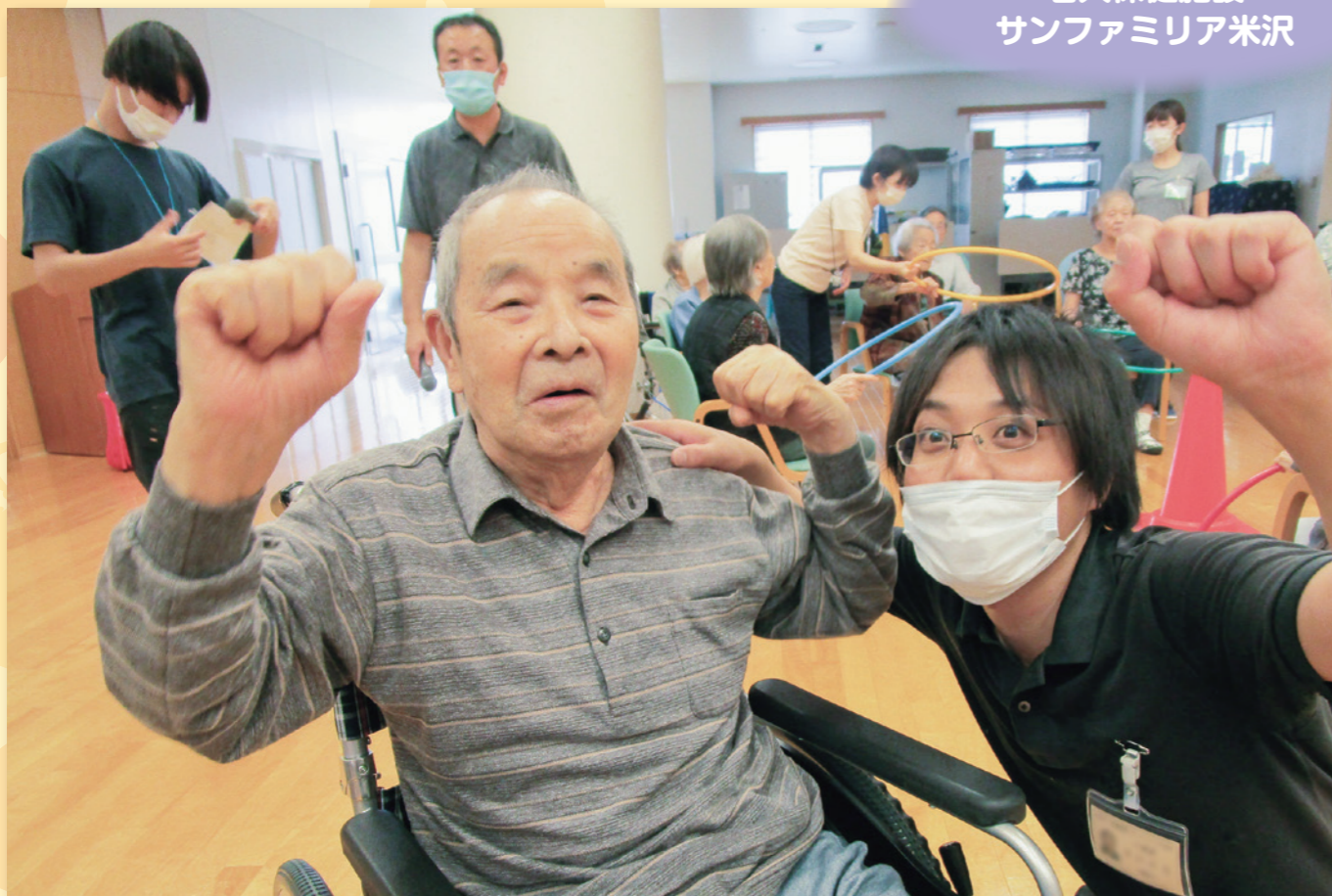
今出来ることを精一杯！ファミリンピック開催！！