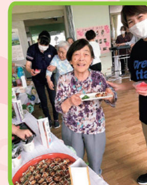
おいしいご馳走♪ いただきます!