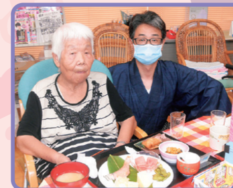
おいしい食事でお祭り気分♪