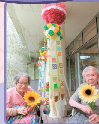
七夕とひまわり。 きれいです!!