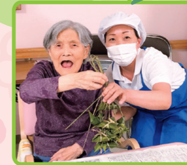
七夕作成隊! 頑張りました!!