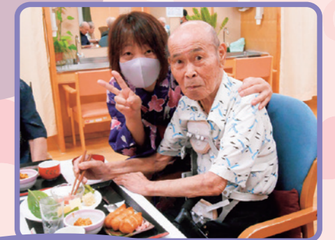
デイサービスセンター サンファミリア米沢