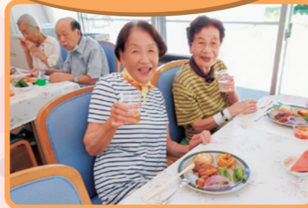
暑い夏にこの一杯!最高です!!