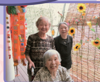
皆さん、素敵な笑顔です。