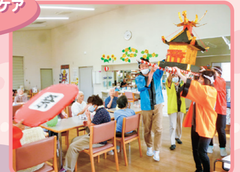
神輿をかっいで 「ワッショイ×2!」