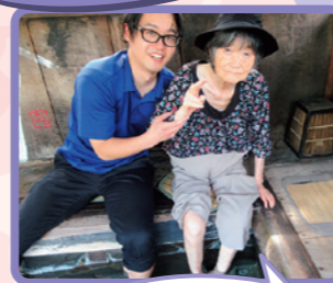
あったかくて 気持ちーなぁ