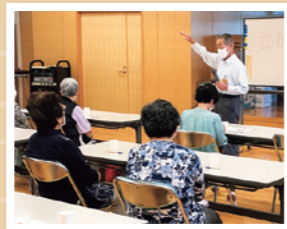
燦燦サロン 「理事長の楽しい授業」より