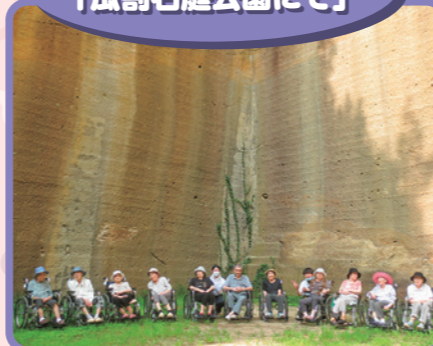
巨大な石壁に皆さん 感動されていました。