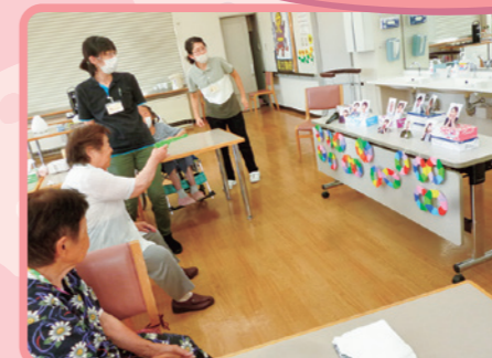
お祭りといえば 「射的」です♪